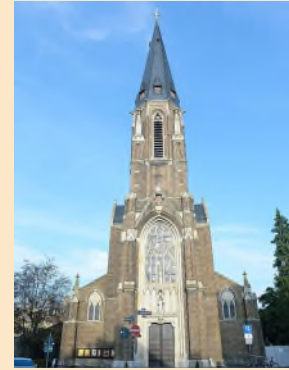
Kirche Sankt Antonius

Seniorencafé in Sankt Antonius Am Donnerstag, 9. April 2026, um 15:00 Uhr lädt das Seniorencafé in Sankt Antonius herzlich zu einem österlichen Nachmittag in den Krohmannsaal des Gemeindehauses (Eingang neben der Kirche) ein.